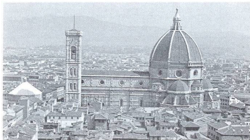
Florència. Visió del Duomo amb el campanile de Giotto, la cúpula de Brunelleschi i el Baptisteri de San Giovanni.

President de la Federació Sardanista de Catalunya