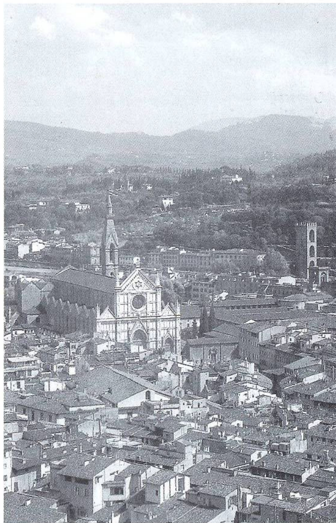
Florència. Santa Croce.

Noi sardanisti la offriamo agli uomini di buona volontà come un messaggio di pace, di giustizia, di fraternità e di bellezza.